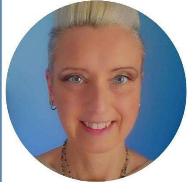
MARTA ERODIANI SCUOLA PRIMARIA

Sono fermamente convinta che la scuola sia un luogo di crescita fondamentale per gli studenti e che il benessere di tutti i componenti della comunità scolastica sia un prerequisito per il successo formativo. Per questo, se eletta al CSPI, mi impegnerò con tenacia e passione a rappresentare gli interessi di tutti, lavorando per un sistema scolastico sempre più inclusivo, equo ed efficiente."