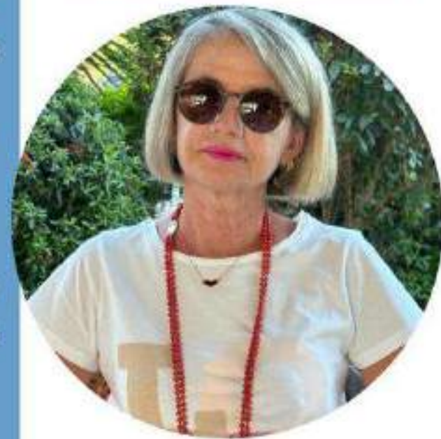
Michela Acconci Scuola Primaria

Ecco il perché della mia candidatura e la scelta di questo Sindacato che ha fatto proprie le lotte per una SCUOLA DEMOCRATICA, LIBERA che sappia dare dignità' alla professione degli insegnanti e che passi anche da una " giusta" riqualificazione economica.